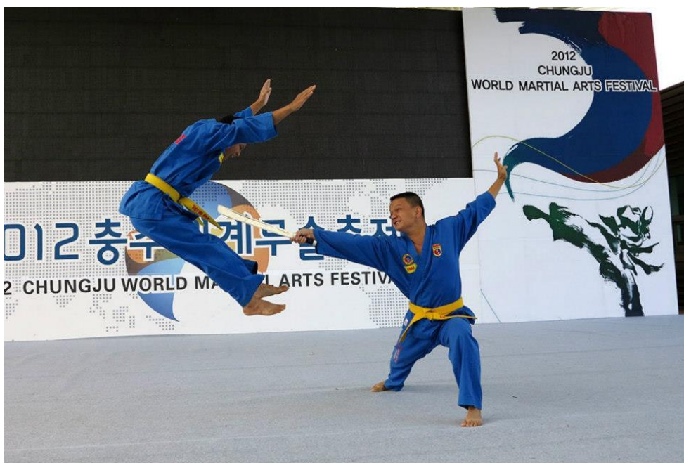
Vovinam quảng bá tại Festival Võ thuật thế giới – Hàn Quốc 2012

Ekip thực hiện chương trình của CNN bày tỏ lòng cảm ơn và trân trọng sự hỗ trợ, hợp tác tích cực từ phía các võ sư, vận động viên đại diện của Vovinam Việt Nam; đồng thời đánh giá rất cao tính chuyên nghiệp và đặc sắc trong phần trình diễn thị phạm của các vận động viên kiện tướng Vovinam.