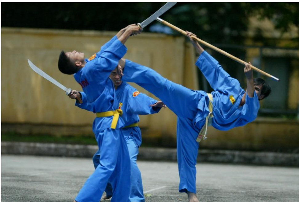
Kỹ thuật vũ khí của Vovinam (trong ảnh- Các võ sĩ Vovinam biểu diễn bài tứ đấu vũ khí)